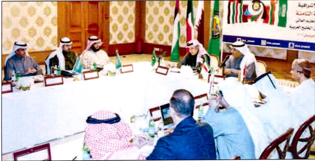
جانب من الاجتماع التحضيري للبطولة